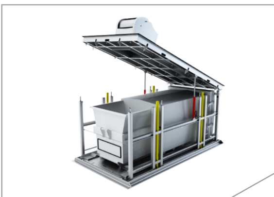
equipo en superficie, tapa abierta