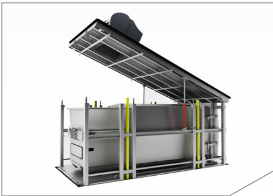
equipo en superficie

El Bigtainer OT es el sistema de mayor capacidad y tecnológicamente más avanzado. El compactador sirve de almacenamiento temporal de los residuos elevándolo al nivel de la calle cuando se efectúa la recogida.